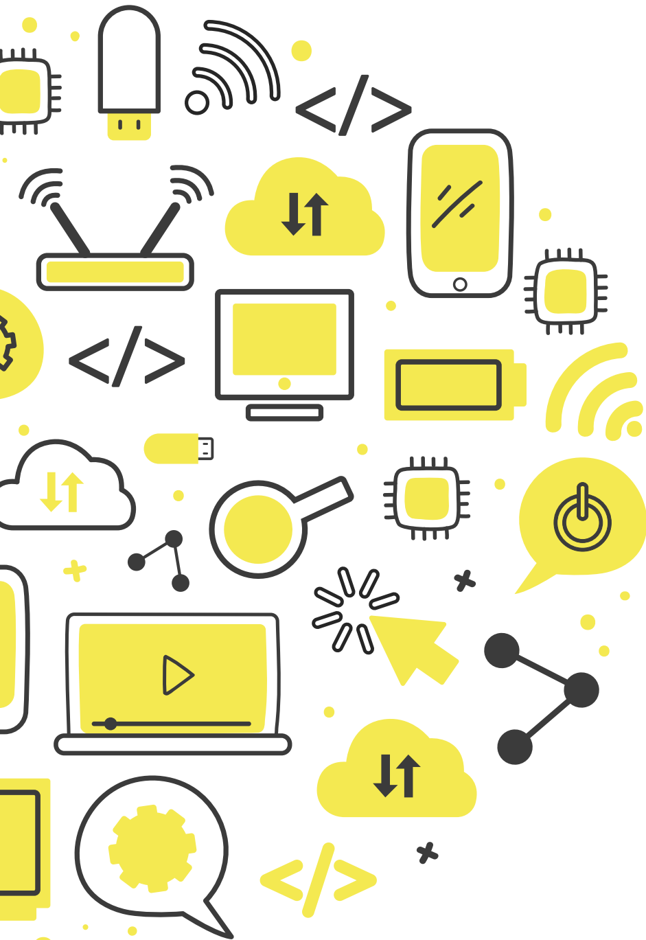
Illustration by Freepik